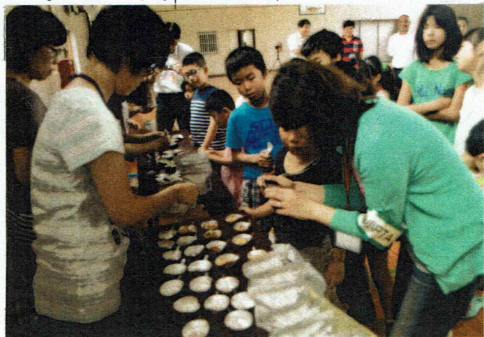
体育館でエイクアートの訓練。

準備する。これも必要である。また、サトモアの確かな、一番興味あったのが、非常食、試食、食マオPTAの皆さんが子供に一庄果物マオていたことが、目についた。今日、終りまで毎年子供達の成長と共に訓練と体験はしていくことは大切だしPTA理事さんは、考えをあらたにして